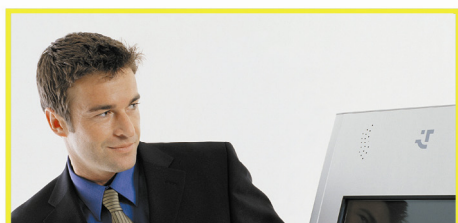
Enkle, digitale brukerløsninger

TS Procon AS ble etablert i 1990. Selskapet fremstår som den ledende leverandøren av interaktive, selvbetjente løsninger basert på informasjon som ferskvare. Selskapet leverer løsninger til bank/finans, offentlig sektor, turisme/reiseliv og varehandel.