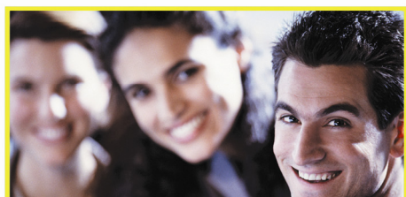
Kommuniser enkelt med folk i farten